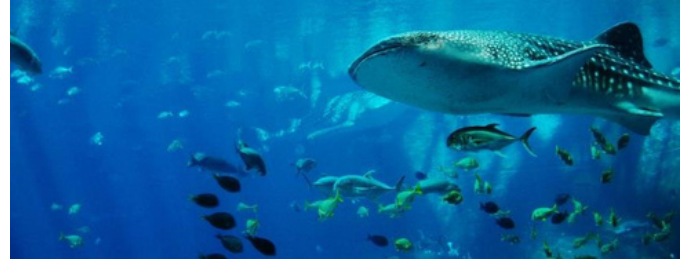
O Aquário Churaumi , reinaugurado em 2002, marcou um avanço na pesquisa marinha e se tornou um dos maiores e mais famosos do Japão

16º dia - Okinawa/ Tóquio (31 mar) Pela manhã, traslado ao aeroporto de Naha para embarque em voo com destino ao aeroporto de Haneda . Chegada, recepção e traslado a área de Asakusa, visitando Templo Sensoji e Nakamise Shopping . Almoço (não incluso) e, na sequência, traslado ao hotel em Tóquio . Tarde livre para atividades independentes.