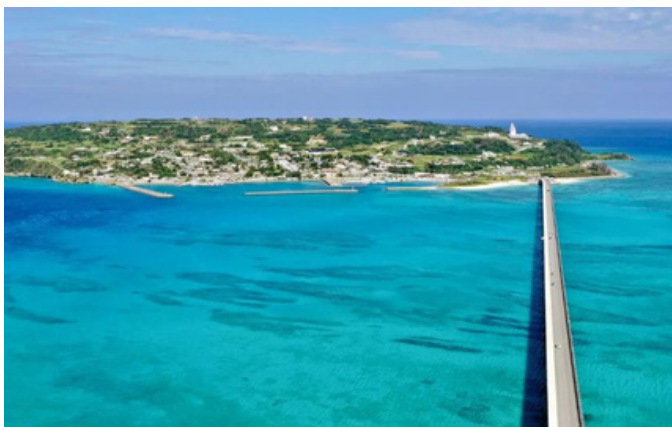
O Ponte Kouri , inaugurada em 2005, conecta Okinawa à Ilha Kouri e simboliza a modernização do acesso às ilhas remotas do Japão.

Após café da manhã saída para passeio diário inteiro em Okinawa visitando o Castelo de Shuri (em reconstrução). Em seguida, passeio de ônibus que percorrerá a Ponte Niraikanai para apreciar a marinha através do Cabo Chinen . Almoço (não incluso) no Okinawa World onde, na sequência, visitaremos a Caverna de Gyokusen , apreciaremos a dança típica "Eisa" e vivenciaremos a experiência de vestir roupa típica da cultura Ryukyu. Retorno ao hotel. Refeições inclusas: Café da manhã.